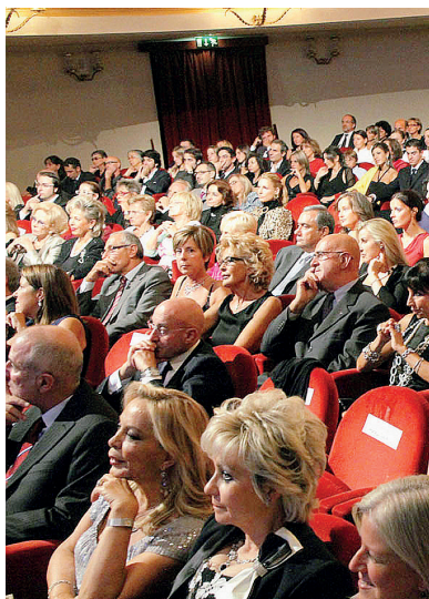
Il pubblico che assiste a "Profilo donna" al teatro Chiabrera

È un lavoro che parte da alcuni punti cardine: non c'è spazio, in questo progetto, per un'idea di donna che cerca rivincite guerreggiate verso il mondo maschile, né per una spinta alla contrapposizione di modelli. Le parole chiave, semmai, sono merito, impegno, determinazione. Soprattutto, tutto ruota intorno ad un concetto passato troppo presto di moda e oggi - come accade nei momenti di crisi - tornato prepo-